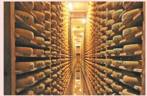
Fort des Rousses

Petit-déjeuner. Retour vers la ville d'origine.