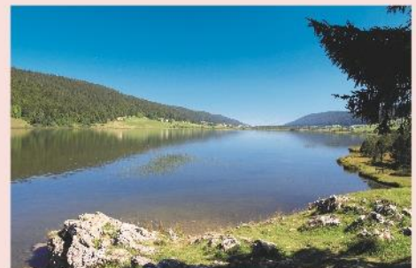
Le lac des Rousses

Le programme d'activités est donné à titre indicatif et est susceptible d'être aménagé selon les conditions météorologiques ou la disponibilité du prestataire. Le programme détaillé sera transmis aux organisateurs au plus tard 7 jours avant le début du séjour. Piscine chauffée à disposition, n'oubliez pas votre tenue de bain!