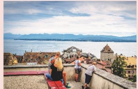
Nyon et son lac